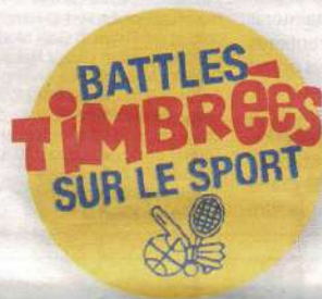
Affiche réalisée par Robert Hugot.

■ Pour en savoir plus et avoir accès notamment à la liste complète des collections exposées : https://www.philaconflans.fr/